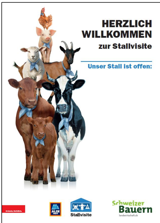
1. Willkommenstafel mit individuellen Öffnungszeiten