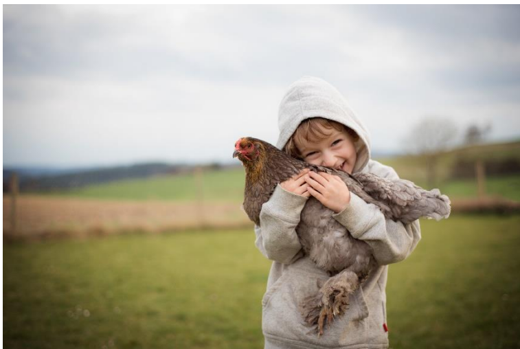
3. Hautnah die Landwirtschaft erleben wird beim Projekt Stallvisite möglich