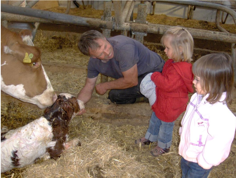
4. Hautnah die Landwirtschaft erleben wird beim Projekt Stallvisite möglich