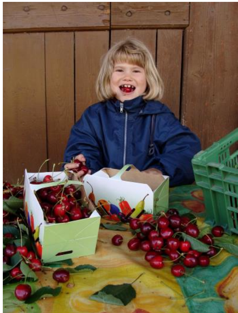
5. Hautnah die Landwirtschaft erleben wird beim Projekt Stallvisite möglich