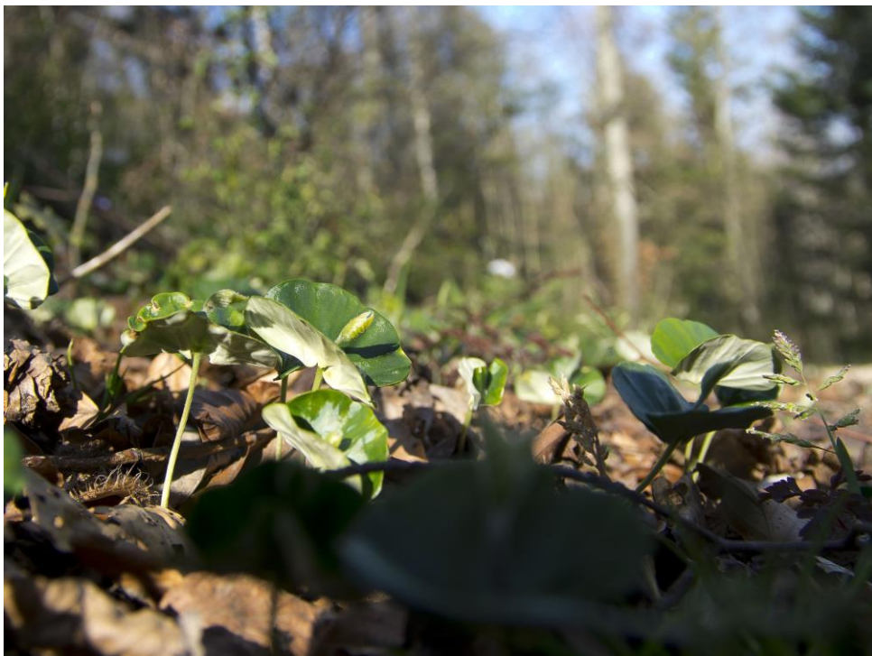
Alle spüren den Frühling, auch die jungen Buchen.