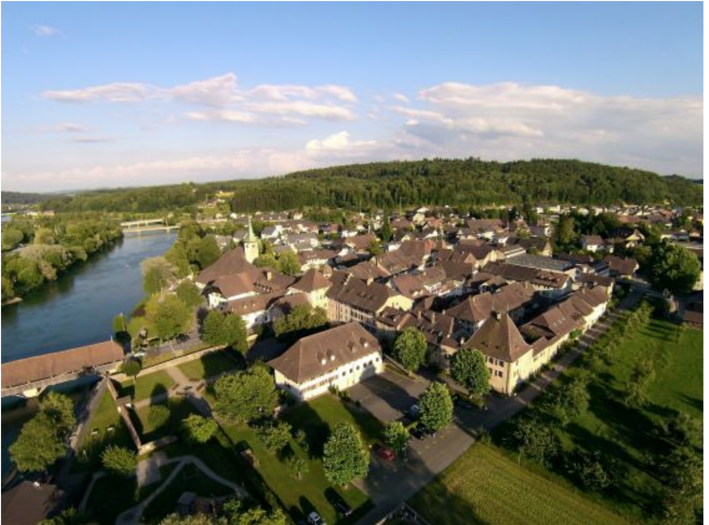
Wangen an der Aare

17. August 2016 Salzhaus Wangen a. A., BE