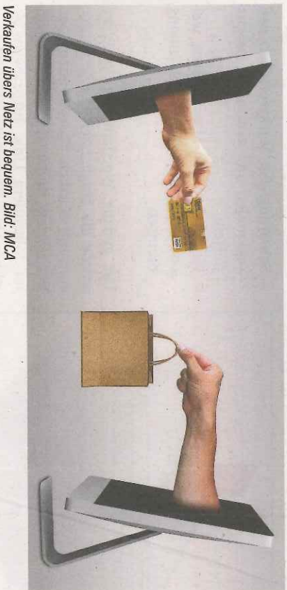
Verkaufen übers Netz ist bequem.

Direktvermarktung ist in Zeiten der Monopolisten und des Preiszerfalls ein elementarer Eckpfeiler für den Abverkauf der eigenen Produkte. Als ergänzender Verkaufskanal zu den üblichen Absatzwegen ist der Direkt-Verkauf über Soziale Medien, die eigene Website oder Plattformen heute nicht zu vernachlässigen.